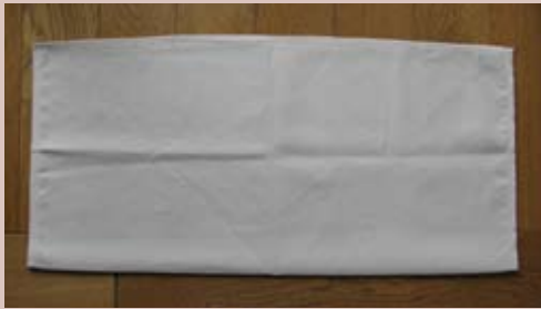
Plier le linge en deux.