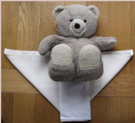
Déposer bébé sur le linge plié.