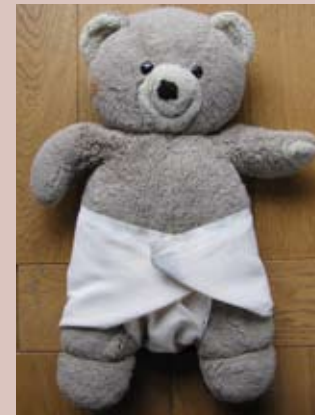
Superposer les deux côtés. Attacher avec un snappy ou sans rien.