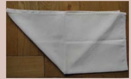
Retourner le tout afin que la partie triangulaire se retrouve en dessous.