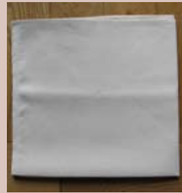
Le plier à nouveau en deux.