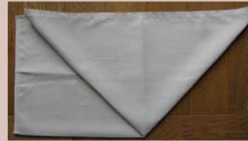
Tirer cette extrémité vers la droite.