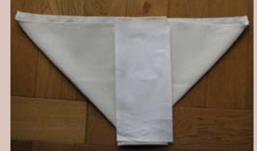
Mettre un feuillet de protection pour recueillir les selles (lavable ou jetable).