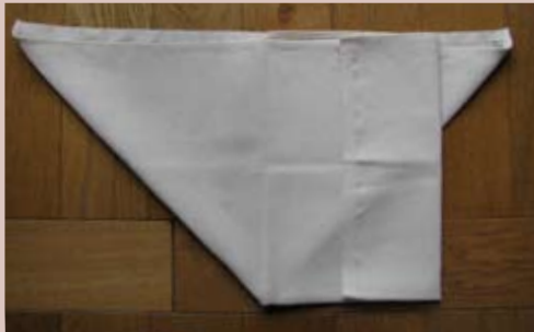
Plier le carré sur son premier tiers.