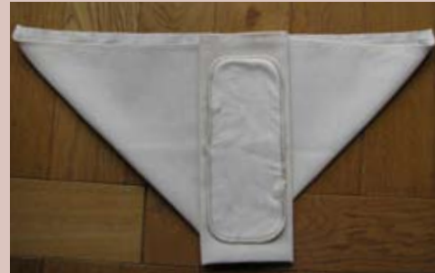
Déposer si nécessaire une doublure pour obtenir plus d'absorption.