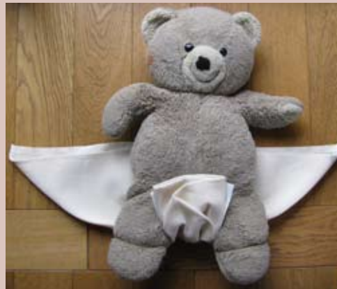
Commencer par mettre la couche sur les parties génitales.