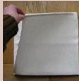
Prendre la première extrémité de tissu.