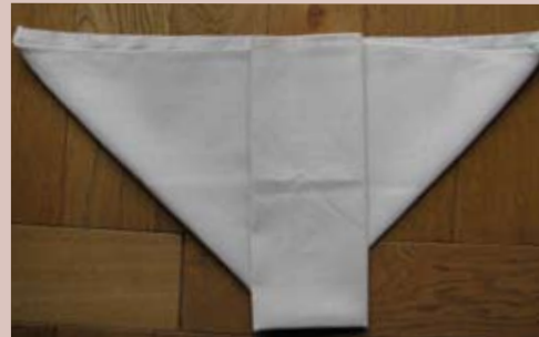
Puis sur son deuxième tiers.