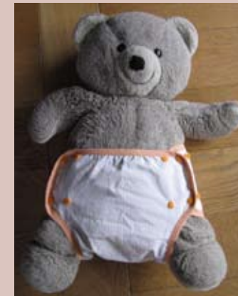
Mettre la surcouche imperméable pour assurer l'étanchéité.